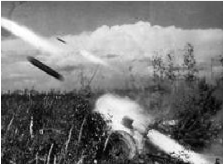
Figuur links: De Duitsers noemden deze raketten "Nebelwerfer" de Britten "Moaning Minnies", naar het krijsende geluid dat ze maakten.

Eind september of begin oktober, kwamen de Duitsers terug op Rips grondgebied en bezetten een smalle strook langs het Defensiekanaal. Vanuit de achterliggende bossen werden de Britten aan de andere kant van de Jodenpeel beschoten met grote aantallen raketbommen.